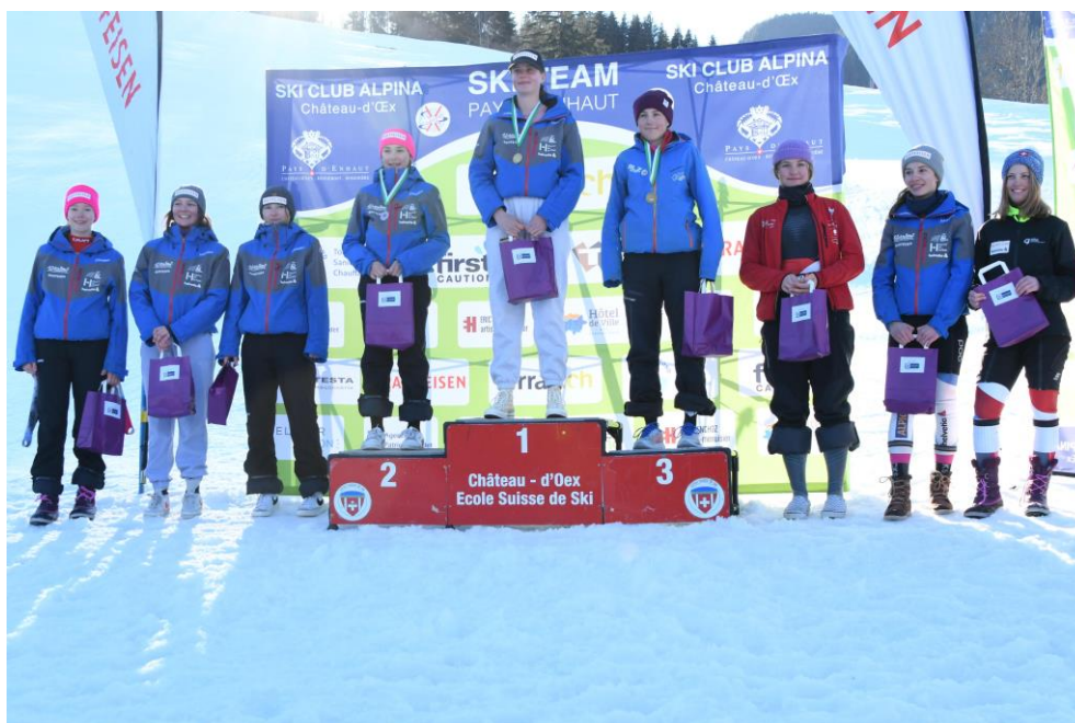
Ski Romand – Ch. de la Planchette 1 – 1860 Aigle